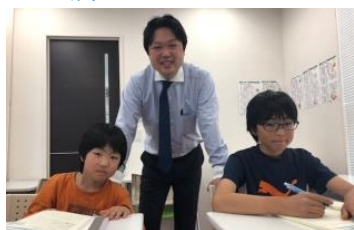
↑わかると勉強が楽しくなります！